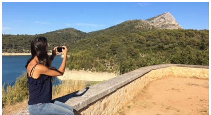
Le barrage de bimont fait peau neuve

La boîte à loisirs revient à Aix en Provence et permet aux jeunes aixois d'accéder à une palette d'activités de loisirs, ludiques et éducatives du 8 juillet au 30 août. La Aix box ne fonctionnera pas du 12 au 16 août.. Pour plus de renseignements appeler le 04 88 71 84 14